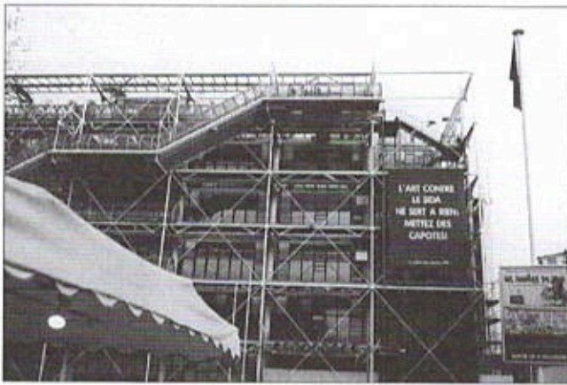
1. Calicot accroché sur la façade du Centre Georges-Pompidou (décembre 1995).

Cependant il fallait un lieu qui soit assez solennel pour favoriser le recueillement et la mémoire. On a ainsi choisi le tepidarium des anciens thermes romains du musée de Cluny qui sont vieux de 1 500 à 2 000 ans.