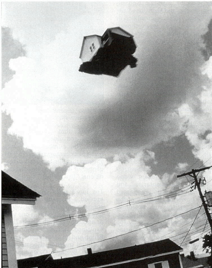
«Mayday». Peter Garfield. «Mobile Home». 1996. Photographie couleur. Color photo

Air Bag , de Simone Decker : la tête dans un sac plastique, un personnage épuise toute la maigre réserve