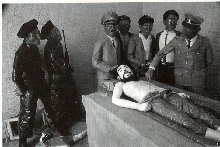
«Mayday». Olivier Blancart. «E Che Homo». 1999. Bandes adhésives, papier kraft. Sticky tape, Kraft paper

festivals that already show movies and videos indiscriminately. The number of awards given to documentaries this year showed that this festival is in real danger of dissolving into the traditional "film festival" circuit.